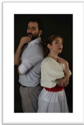
Figura 1: Actores de e-pi-log-0

En este espectáculo, los maestros de ceremonia (Figura 1), con la ayuda de e-pi-log-0 (una inteligencia artificial, Figura 2), hacen viajar a los asistentes en el tiempo para ir presentando a ciertos personajes. El camino se complica y, para poder continuar, se deben resolver diversos y variados retos. Se guía a los espectadores hacia su resolución, lo que llevará a encontrar al saboteador que está poniendo trabas al viaje.