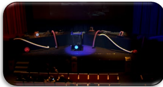
Figura2: e-pi-log-0: la máquina

De esta forma, a lo largo de la representación, el público tiene que resolver los diferentes retos que se plantean y que están relacionados con cada una de las disciplinas que realizaban los personajes no reconocidos a lo largo de la historia, para poder dar con las pistas que lleven a desenmascarar al saboteador.