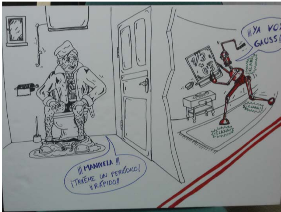
Figura 3. Panel relativo al concepto de número periódico