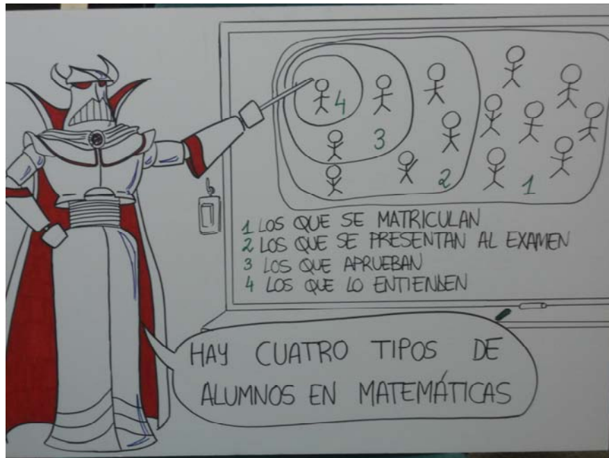
Figura 5. Panel relativo al concepto de conjuntos y subconjuntos