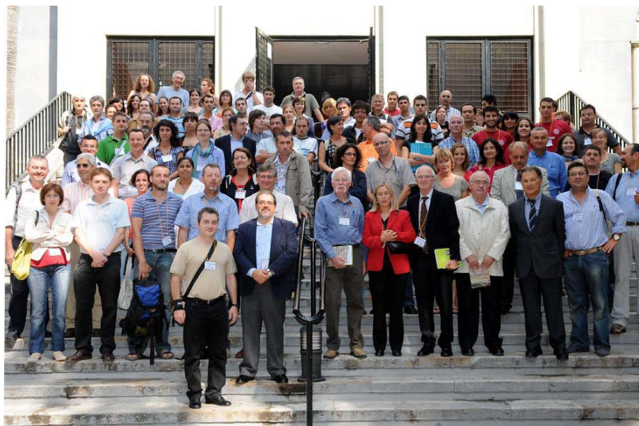
Foto de Grupo de los Asistentes al congreso